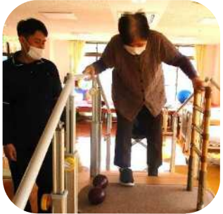
お手玉上手に出来るかな〜