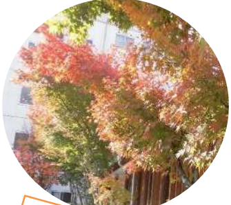
紅葉がきれいだな〜