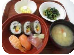
にぎり寿司は久しぶりで美味しいな〜♪♪