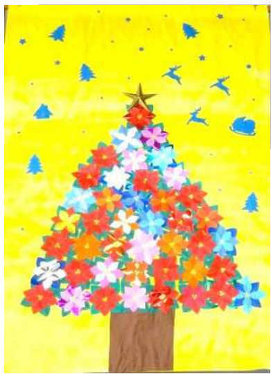
「カラフルなクリスマスツリー」