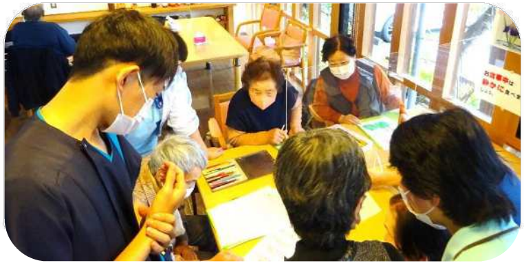
みんなで相談しながら問題を解いてま〜す